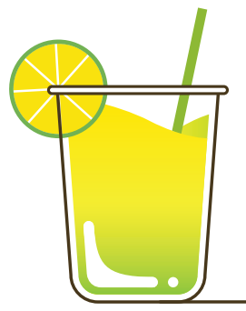
20 לימונדה קפואה עם עלי מנטה טריים בבלנדר.